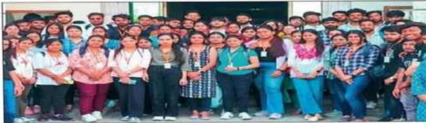
एमआईईटी में शुरू हुई प्रतियोगिता में शामिल विद्यार्थी। संवाद