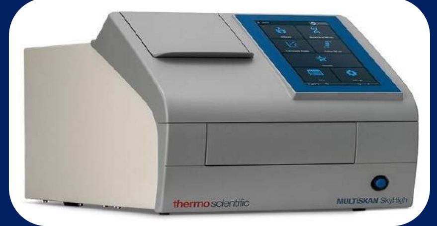
Multiskan Sky High Microplate Spectrophotometer, 51119700DP