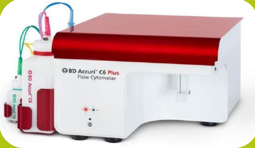
BD Biosciences Accuri C6 Plus Flow Cytometer, C6 Plus