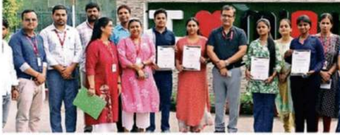
एमआईईटी में कार्यशाला के समापन समारोह में शामिल प्रतिभागी० सी. कलेज