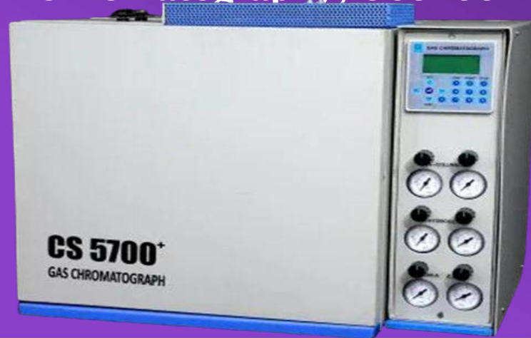
Centurion Scientific CS5700+ Gas Chromatography, CS5700+